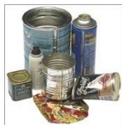
METAL + ALUMINIU