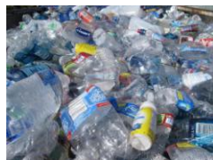
PLASTIC PUNGI FOLIE